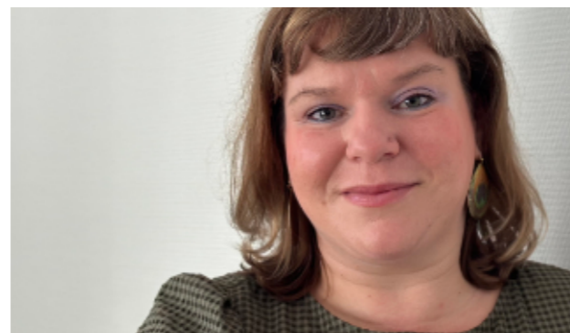
BA PFLEGE Geschäftsführerin